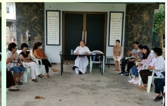
วัดบางแสน การ์ดไม้ตก